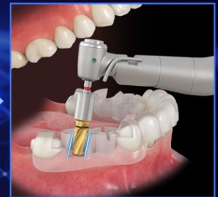
New Open-Angled 적용